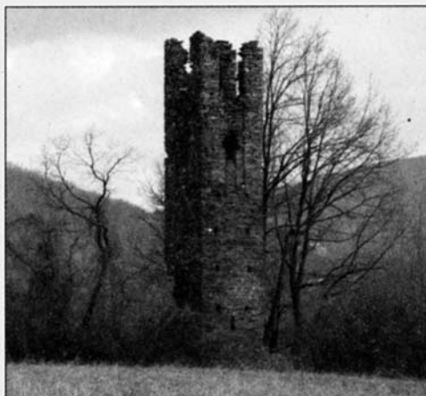
Nella foto, la torre di sant'Antonino a Farini, una delle tappe della Via degli Abati.

B obbio, grazie alla fondazione della famosa Abbazia nel 614 da parte di San Colombano, fu uno dei più importanti centri della cultura altomedievale, tanto da essere nominata la Montecassino del nord. Città d'Arte dell'Emilia-Romagna, è stata inserita, dal Touring Club Italiano, nelle 119 località dotate di marchio di qualità (bandiera arancione). Nel 2008 Bobbio è stato inserito, con altri 149