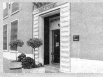
La sede centrale dell'istituto di credito

«Bisogna tornare – scrive Magnaschi – alla ragionevolezza nella quale la posizione vetero-snobistica di Corrado Sforza Fogliani, presidente della florida Banca di Piacenza («I subprime? So gnan cus ien, me»), ossia «I subprime? Non so nemmeno che cosa siano io») si sposa perfettamente con lo slogan operativo di una grande volpe dei mercati finanziari internazionali come Warren Buffet che dice: «Non ho mai acquistato ciò che non ho capito che cosa fosse».