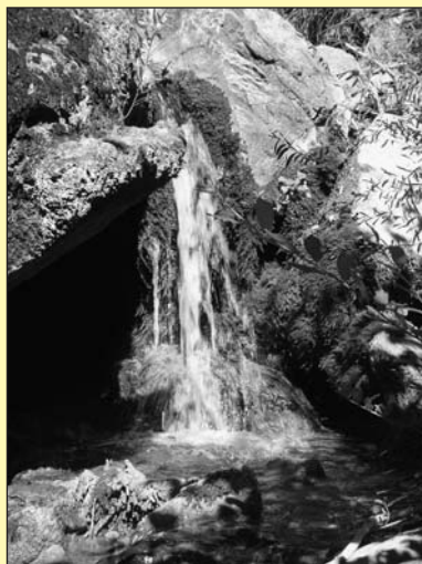
La fonte dell'acqua Alta Valle

Da qualche settimana è possibile portare quest'acqua minerale sulle nostre tavole. L'acqua, infatti, è imbottigliata dalla Valtrebbia Acque Minerali - azienda cliente primaria della nostra Banca - nello stabilimento di Rovigno (GE), proprio dove sgorga. L'acqua minerale "AltaValle" è un'acqua oligominerale molto equilibrata, con un basso contenuto di sodio, che fornisce il corretto apporto di sali minerali importanti quali calcio e magnesio. Il bassissimo contenuto di nitrati è un indicatore della sua purezza. È ideale nelle diete povere di sodio, e svolge un'azione diuretica che la rende indicata per favorire il buon funzionamento di fegato e reni.