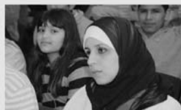
Alcuni immigrati e la sala gremita

ne. Sono in Italia da 15 anni - ha aggiunto - ed è la prima volta che vengo invitato ad un incontro di questo tipo. Grazie».